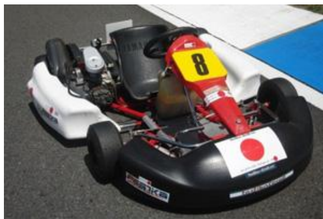
Enjoy レンタルカート FK-5 50CC