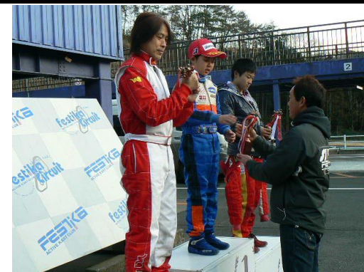
やっぱりうれしい表彰台！