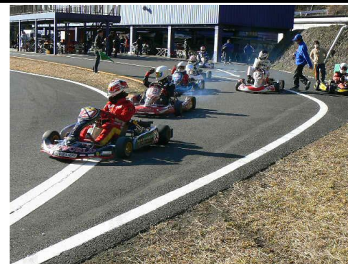
順番にコースイン！