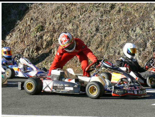
いよいよファイナル②！