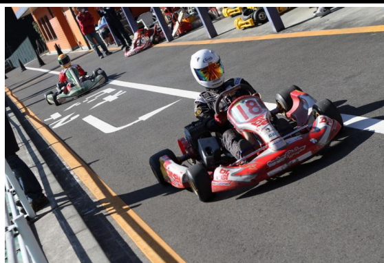
ファイナル② 優勝 木綿豆腐！