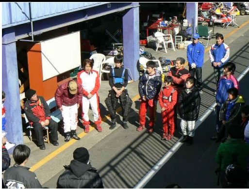
和やかなドラマです。